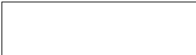
Foto van aanvrager Recent en heel gelijkend In kleur 45 X 35 mm Lichte egale achtergrond Foto moet tekst bedekken maar mag randen van kader niet bedekken

Niets boven deze lijn schrijven (behalve handtekening)